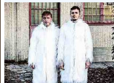
▲ «The Rose Alien Tour»

● Danza Urbana Il Festival si apre con gli spettacoli «The Rose Alien Tour / Episodio 1 - Human space» (piazza Maggiore, ore 19) e «If there is no sun» (DumBO, ore 20) e con il talk «Afrofuturismo e decolonizzazione della cultura» (DumBO, ore 21). Vari luoghi, info https://www.danzaurbana.eu