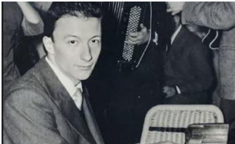
Amedeo Tommasi, virtuoso del pianoforte

Giuseppe Tornatore . L'altra stella sarà invece dedicata a Jimmy Villotti , scomparso lo scorso dicembre, chitarrista per eccellenza del jazz, bolognese, al fianco dei nomi più famosi della musica italiana, da Ornella Vanoni, Vinicio Capossela e Paolo Conte, che lo ha raccontato nella canzone